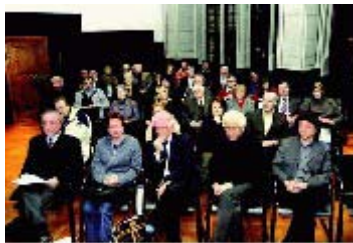
Rund fünfzig Bürger kamen zur Gedenkveranstaltung in den historischen Sitzungssaal im Rathaus

Am Dienstag jährte sich zum 59. Mal der Tag der Befreiung des Konzentrationslagers Auschwitz durch russische Truppen am 27. Januar 1945. Bundespräsident Roman Herzog hatte diesen Tag während seiner Amtszeit zum Gedenktag für die Opfer des Nationalsozialismus proklamiert. Auch die Marburger Bürger gedachten am Dienstagabend im historischen Sitzungssaal des Rathauses der Verschleppten und Ermordeten des NS-Terrors.